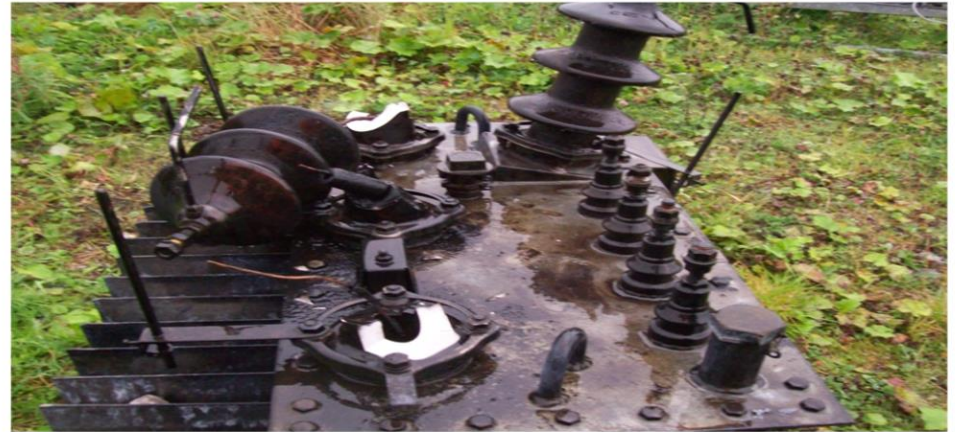
Transformator skadet av lynnedslag